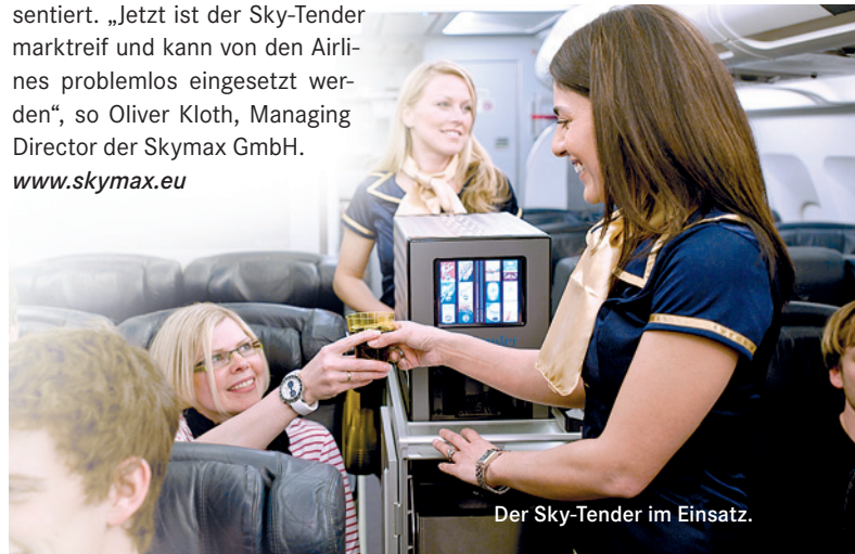
Der Sky-Tender im Einsatz.